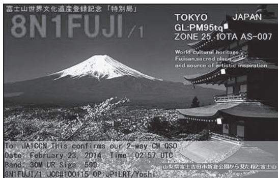
図4-2 eQSLで届いたQSLカード

JARL発行アワードでは、電子QSLシステムのeQSL ※41 (p.91のコラム3参照)で届いたQSLカード(図4-2)やE-Mailで届いたPDF形式のQSLカードなどでも、それが紙に印刷されていればQSLカードとして有効です。一般のアワードもほとんどがJARLに準じていますから、同様に有効と判断できます。無効な場合はルールに明記されています。